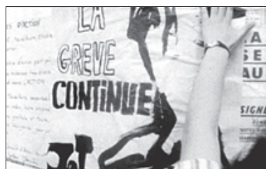
'UN FILM COMME LES AUTRES' ▶ Godard graba el debate que se establece entre estudiantes y obreros.