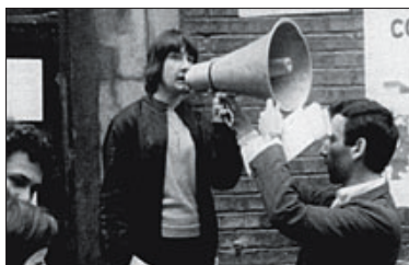
'CA 13' ▶ Corto sobre la ignorada pero vital actividad de los Comités de Acción de estudiantes y obreros.