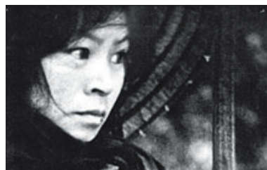
'LOIN DU VIETNAM' ▶ Godard, Resnais y Varda, entre otros, firman este filme colectivo antiguerra.

El actor y director Sean Penn preside el jurado de este año, constituido por Alfonso Cuarón, Natalie Portman, Marjane Satrapi y Sergio Castellitto. La elección de los galardónados no les resultará nada fácil. Hay demasiados directores consagrados. La lista asusta a cualquier debutante: Clint Eastwood ( Changeling ), Steven Soderbergh (con un Che de cuatro horas), Walter Salles ( Linha de passe ), los hermanos Jean-Pierre y Luc Dardenne ( Le silence de Lorna ), Philippe Garrel ( La frontiere de l'aube ), Atom Egoyan ( Adoration ) y Wim Wenders ( The Palermo shooting ). Entre medio, Quentin Tarantino brindará una clase magistral y Robert de Niro acudirá a la clausura con la película What just happened . ≡