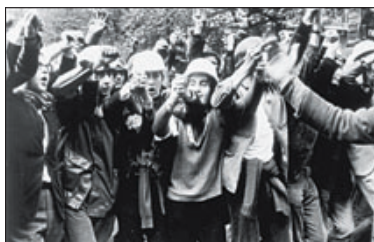
'GRANDS SOIRS ET PETITS MATINS' ▶ La cinta de William Klein no retrata Mayo del 68; es Mayo del 68.