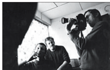
'CLASSE DE LUTTE' ▶ Los obreros prescinden del director Chris Marker y filman su propia película.