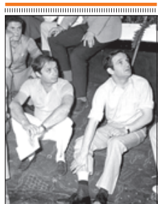
▶▶ Lelouch y Truffaut, en 1968.